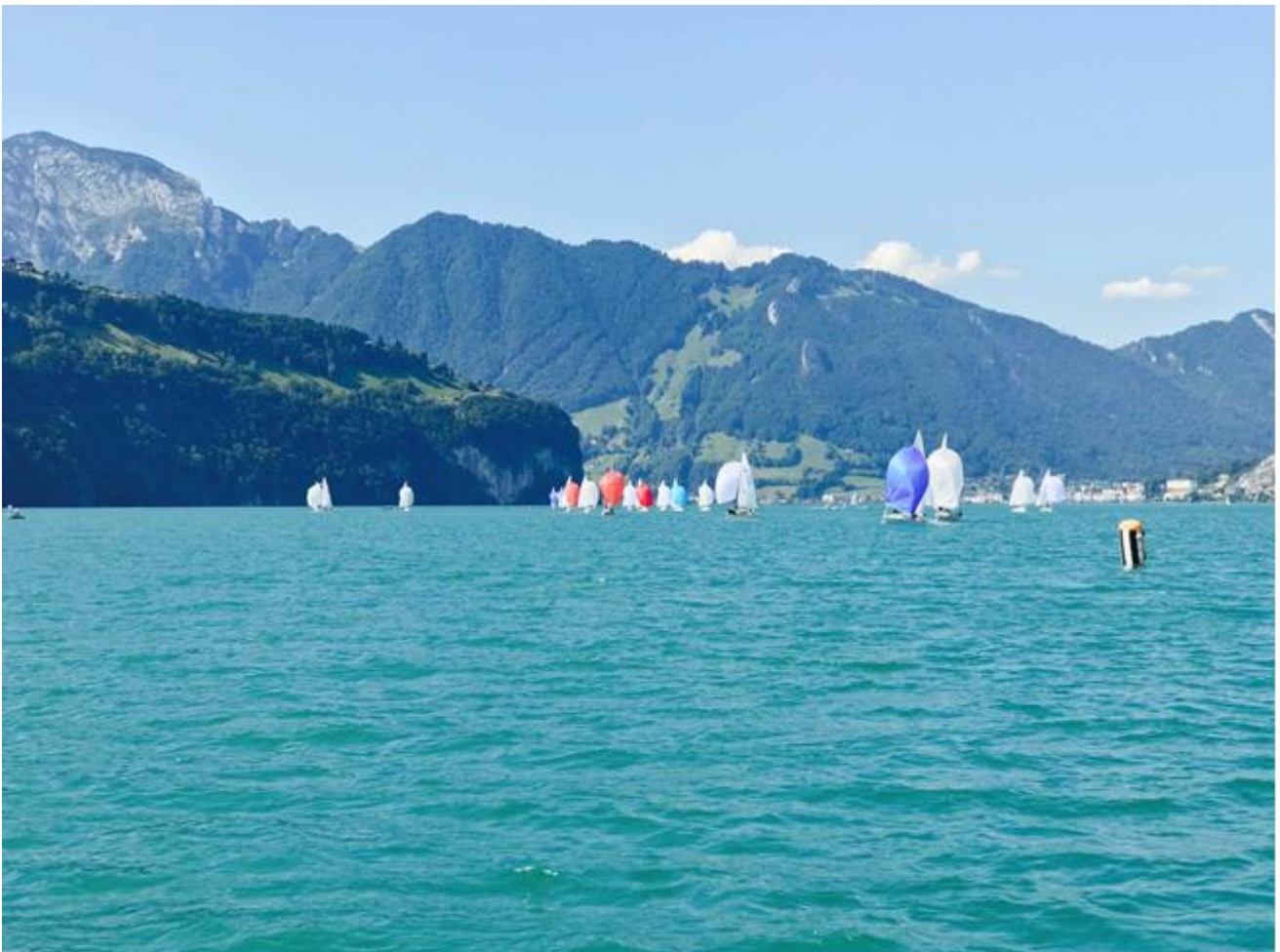
Blick von Sisikon Richtung Brunnen

Der Regattaverein Brunnen führt jedes Jahr rund 10 Regatten durch. Immer wieder werden hier Schweizer-, Europa- und sogar Weltmeisterschaften durchgeführt. Nebst dem Regattieren soll aber auch das gesellige Vereinsleben nicht zu kurz kommen.